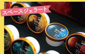
スペースジェラート