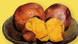
本場種子島産 安納芋