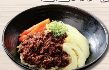
加賀太きゅうりのジャージャー麺