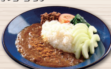
加賀太きゅうりのまぜカレー