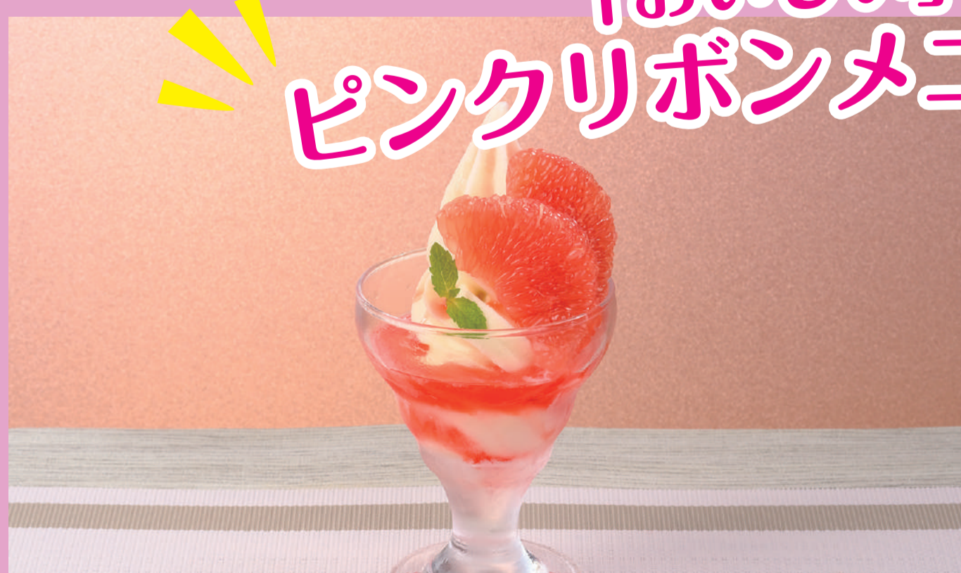
ミニパフェ ピンクグレープフルーツ