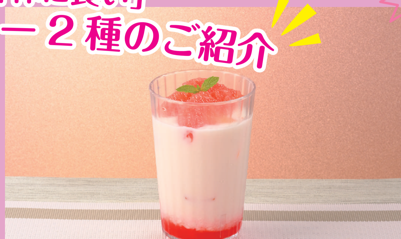
ピンクグレープフルーツの ヨーグルトオレ