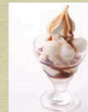
白玉ソフト(黒蜜きなこ)